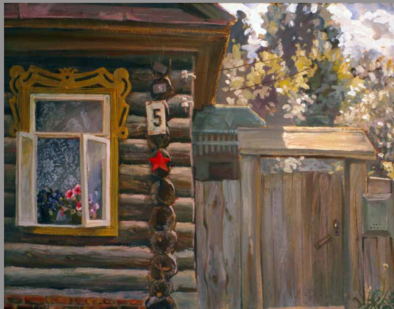
Окно. к. темпера, 50x40, 1987