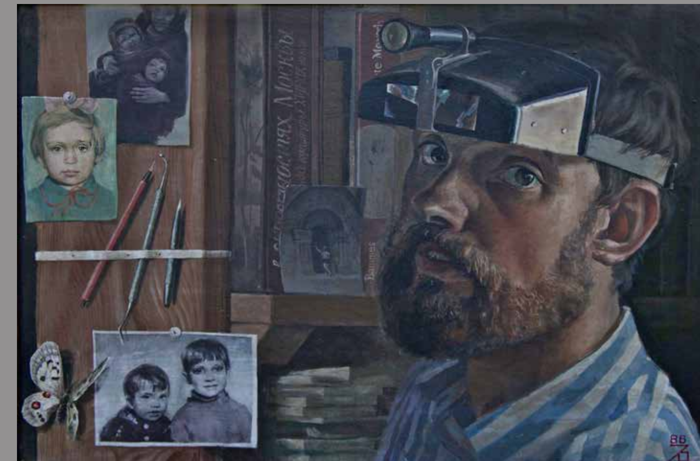
Автопортрет. к. темпера, 55x35, 1986